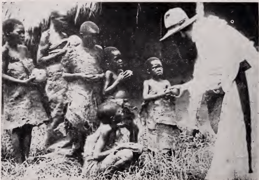
El Misionero Católico conoce a fondo el precepto divino de la caridad. He lo aquí distribuyendo el pan a sus negritos.